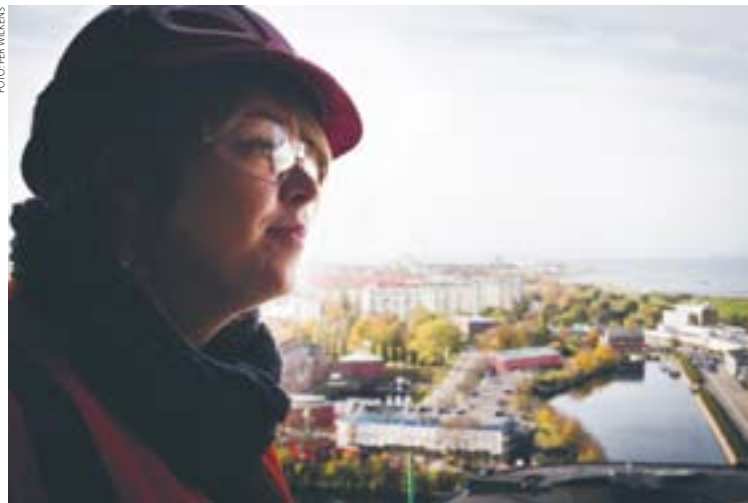
– Hur vi fysiskt planerar är oerhört viktigt, säger kommunalrådet Katrin Stjernfeldt-Jammeh. Här blickar hon ut över staden.