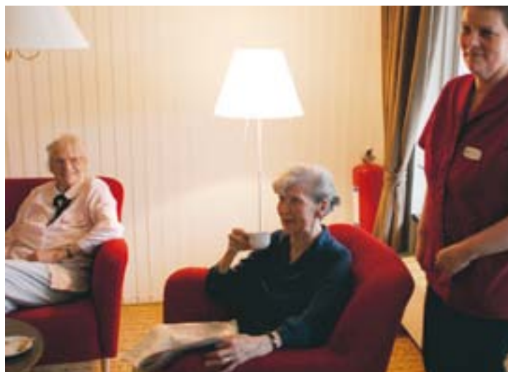
Omsorgen om äldre är en stor och viktig fråga i det kommunalpolitiska handlingsprogrammet.

I god tid före årsmötet kommer ombuden att få förslaget skickat till sig för att kunna gå igenom förslaget i sina föreningar och klubbar.